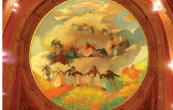
Plafond de l'opéra

→ Office de tourisme, 11 rue Saint-Yves Tous les samedis à 15 h et 15 h 30 Tous les dimanches à 11 h 30 et 15 h sauf indisponibilité du Palais En semaine à des horaires variables