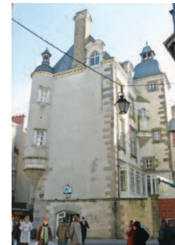
Hôtel de Robien

→ 43 rue de Redon Durée 40 minutes Inscription obligatoire. à 12 h 45 Mardi 13 mars 18 h 15 Jeudi 15 mars Tarif : 4 €