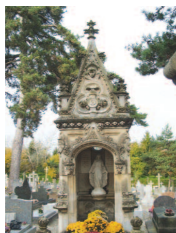
Tombe Oberthür - Cimetière du Nord

Inscription conseillée. → Office de tourisme, 11 rue Saint-Yves à 14 h 30 Mercredi 7 mars