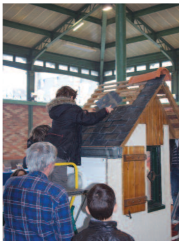
Forum du patrimoine

Inscription obligatoire au 02 99 67 11 07