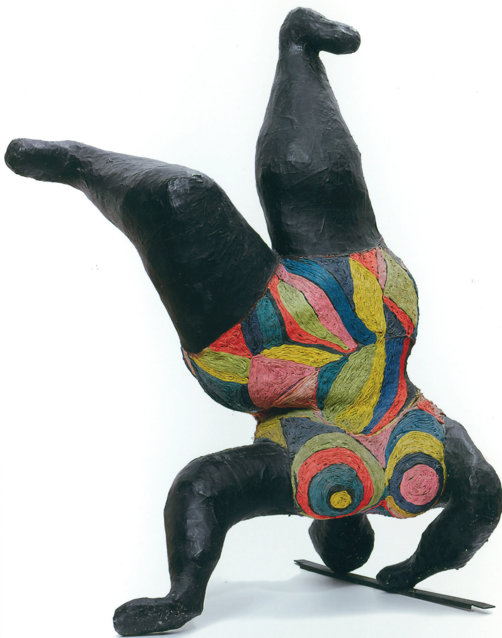
Niki de Saint-Phalle, Nana noire , 1965. © Adagp, Paris, 2023