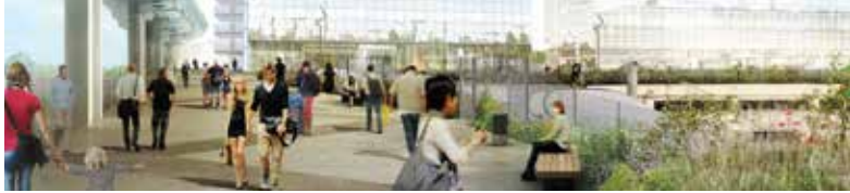
#rennesmetropole #business #eurorennes #gareconnectée #1h25deparis