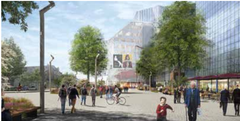
#rennes #capitaledelabretagne #business #metro #congrès